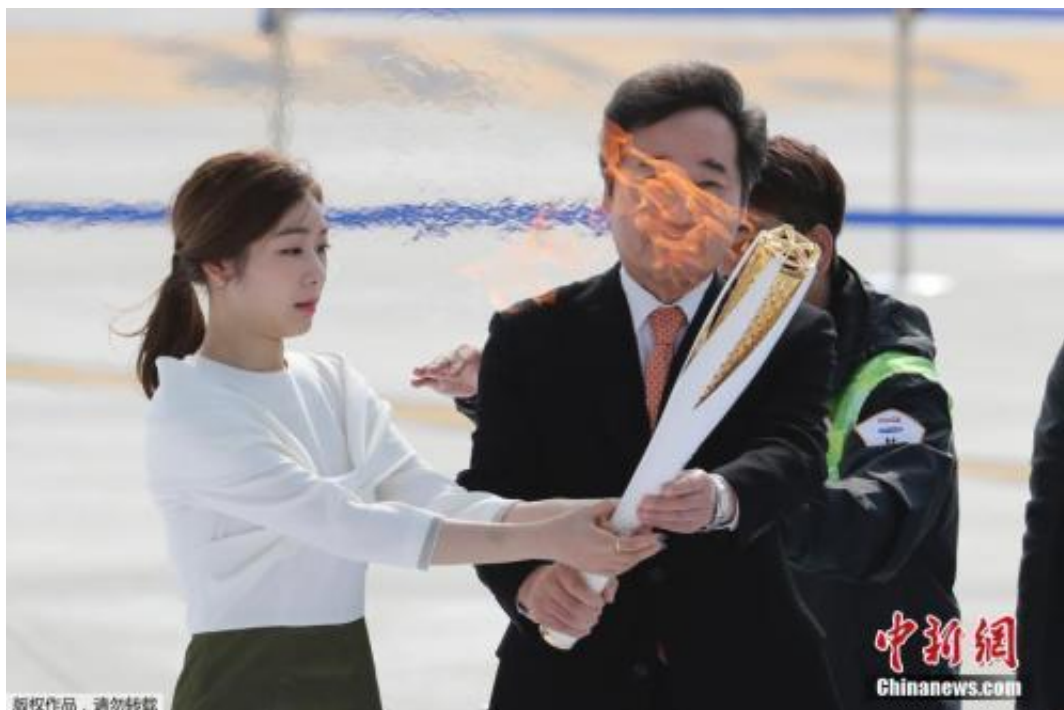
资料图：韩国总理李洛渊(右)、平昌冬奥宣传大使金妍儿(左)手持圣火。

在大田，火炬曾在两个机器人之间传递；在原州市，两名火炬手在悬索桥上完成交接；在济州，火炬传递曾在海水中进行；在江原道，奥运火炬又登上热气球在空中传递……回顾圣火传递过程，可谓创意十足。