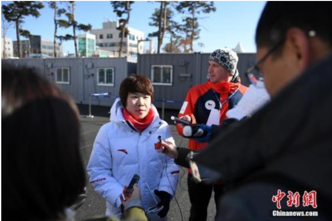
周洋接受媒体采访。

平昌是周洋奥运之旅的第三站。8年前在温哥华，19岁的周洋从韩国队的集体战术中突围，粉碎了对手在短道速滑女子1500米项目上三连冠的美梦，并与队友一道获得3000米接力冠军；4年前在索契，周洋终点线前超越沈石溪，上演了最完美的绝地反击，卫冕1500米金牌。